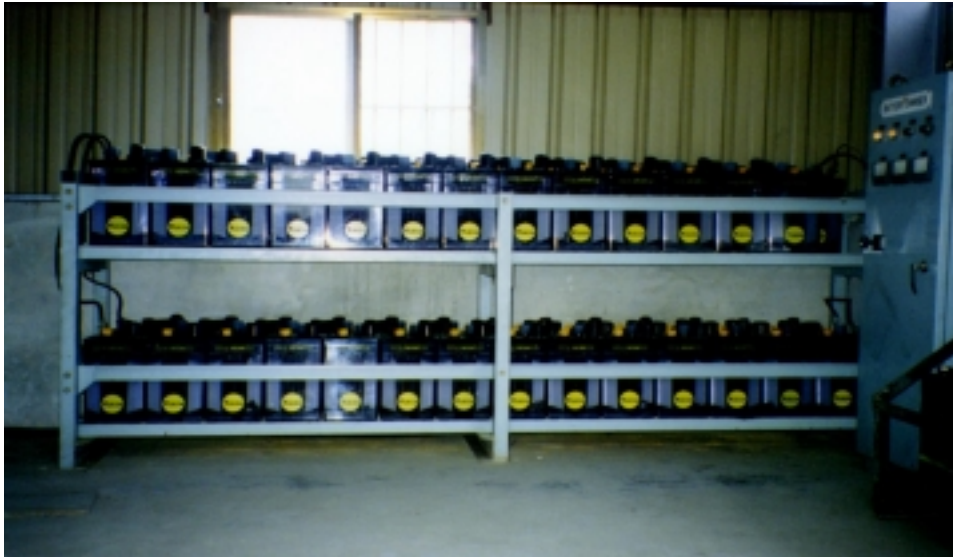
圖 2 蓄電池的通風條件